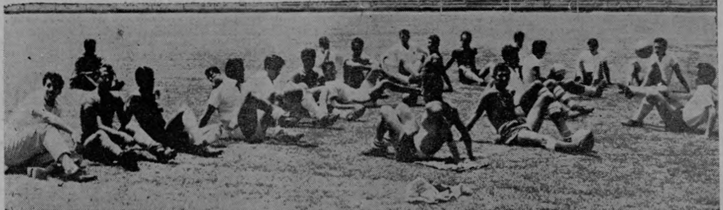
Los integrantes del Seleccionado Mexicano de Fútbol, que desde el miércoles son nuestros huéspedes, se trasladaron ayer al Estadio Nacional con el objeto de realizar sus entrenamientos considerados indispensables muy especialmente para los equipos visitantes...